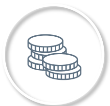
Lønn & HR