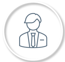
Utleie av ressurser